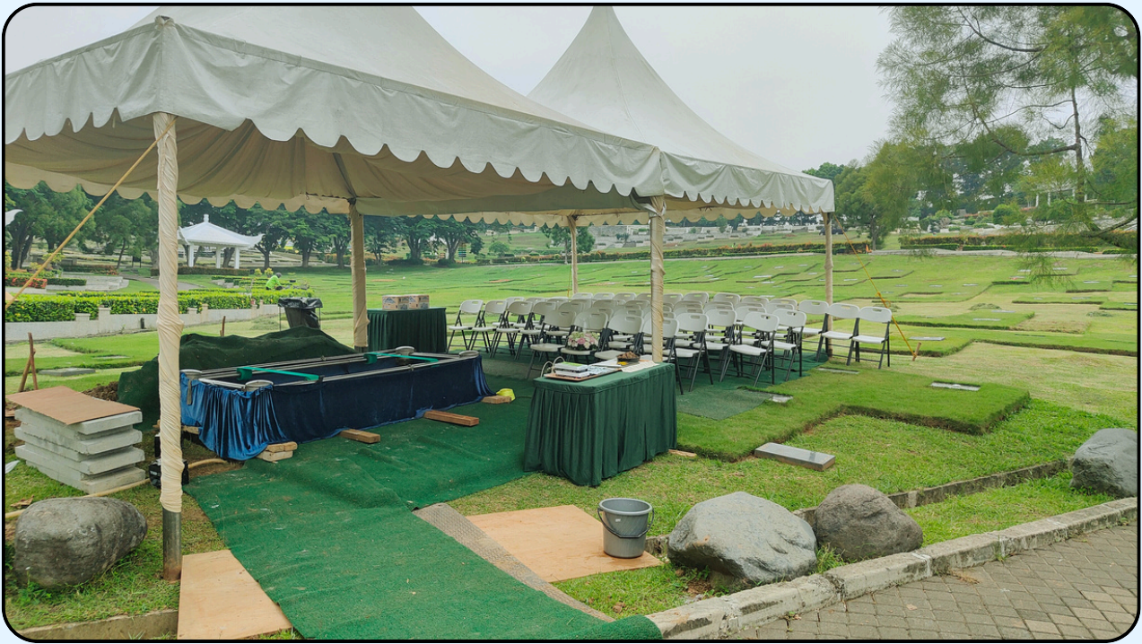
Acara pemakaman menggunakan paket tenda standar