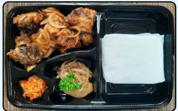
4. Nasi Ayam Goreng Mentega

Catatan : Jika memerlukan tambahan makanan, bisa order di Lacolina Resto Sandiegohills.