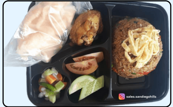
2. Nasi Goreng Kencur