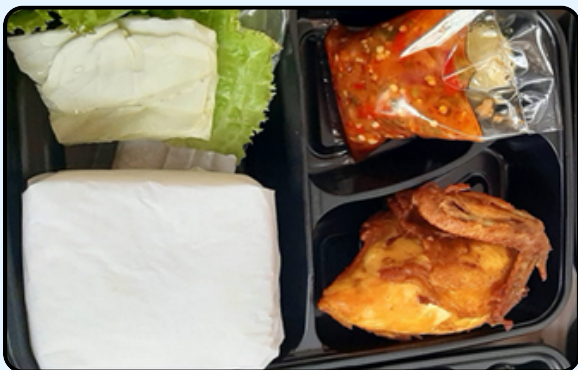
3. Nasi Ayam Penyet