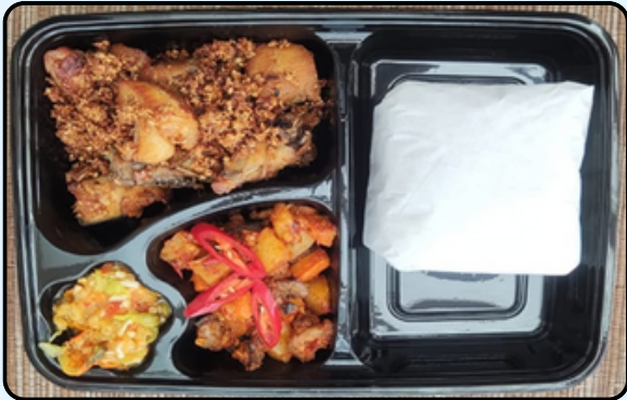
1. Nasi Ayam Goreng Ketumbar