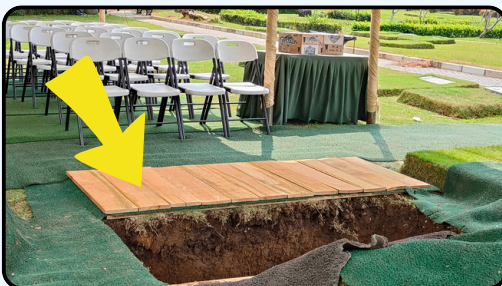
Papan Penutup di sediakan