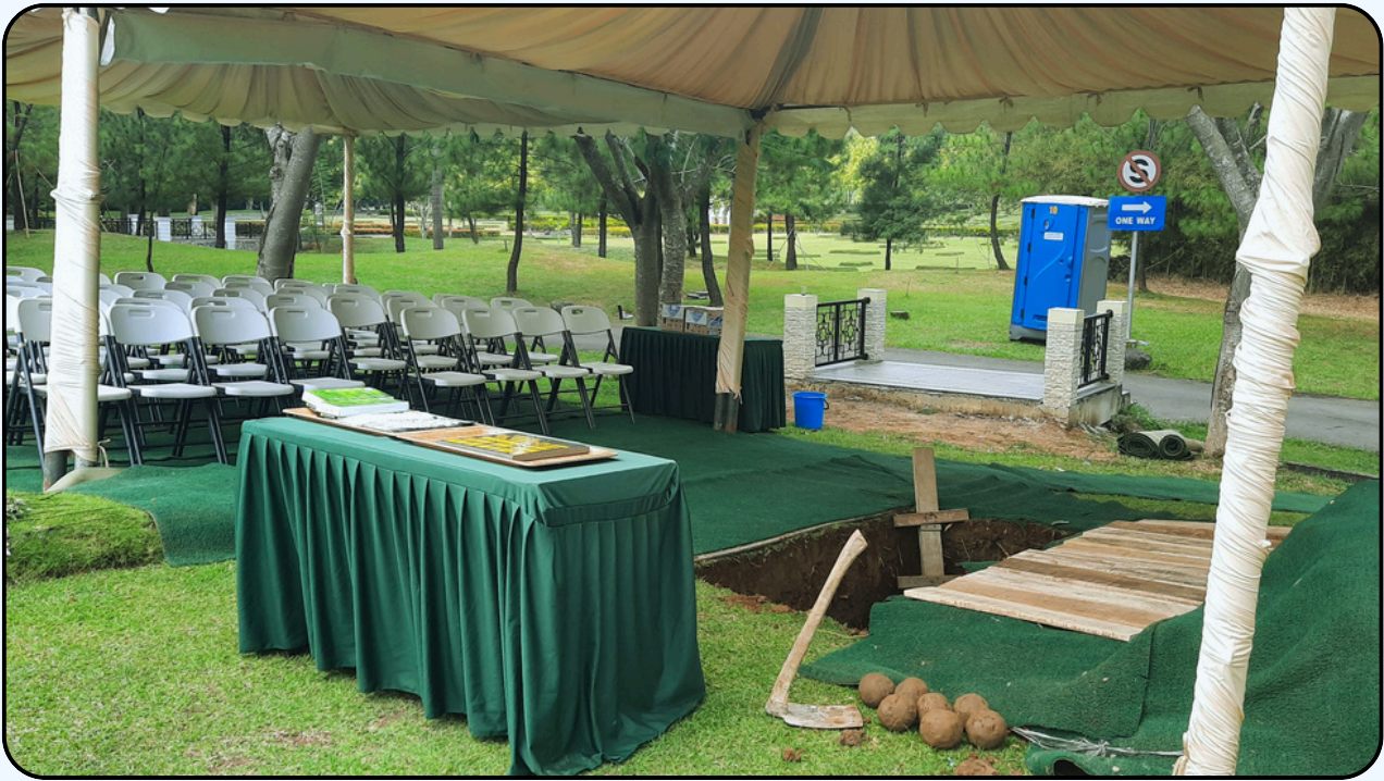
Acara pemakaman menggunakan paket tenda standar