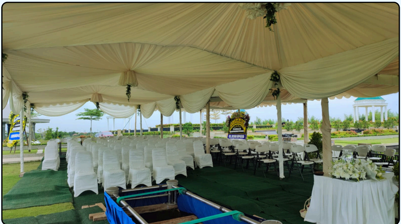
Warna : putih dan Krem