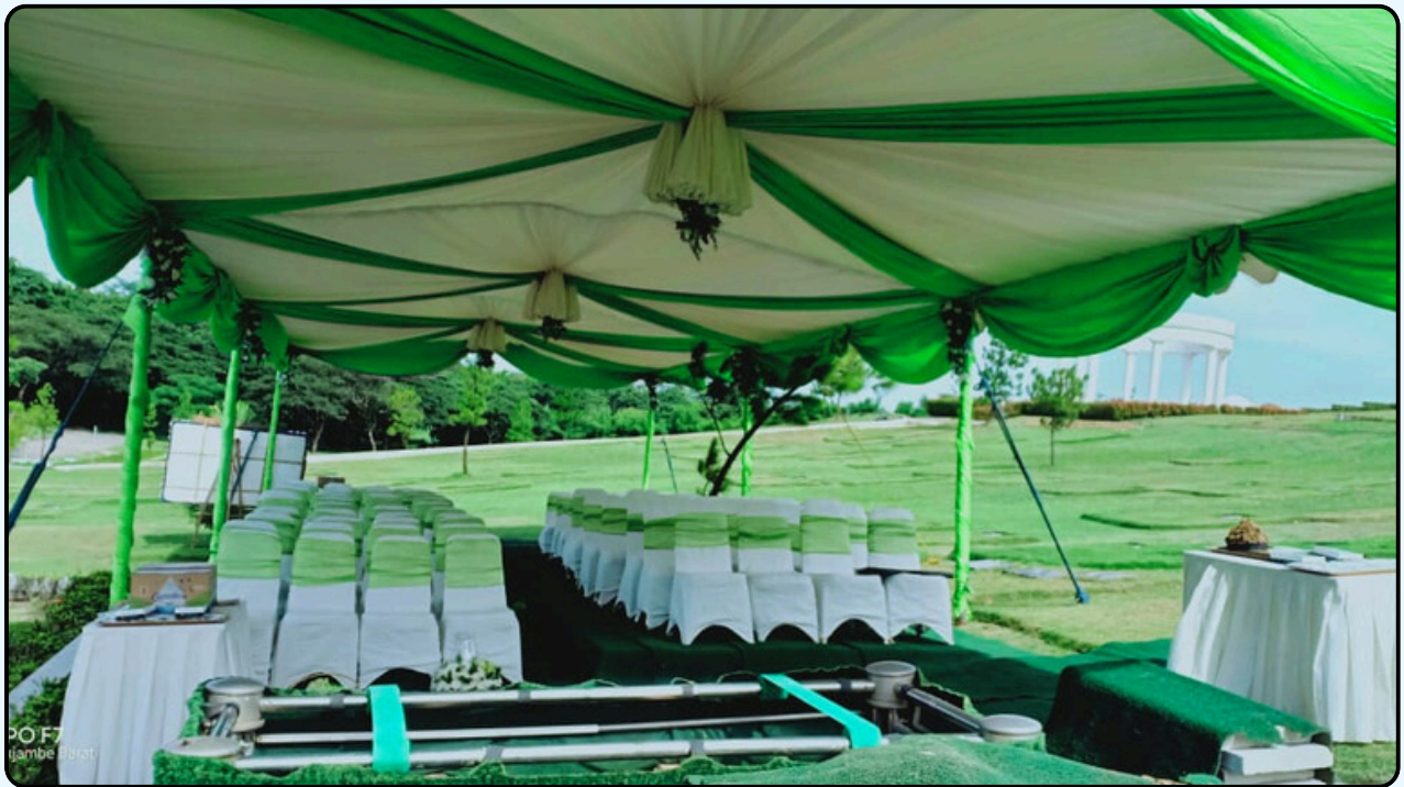
Warna : Hijau dan Krem