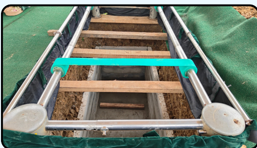
Kotak Beton Pelindung Peti