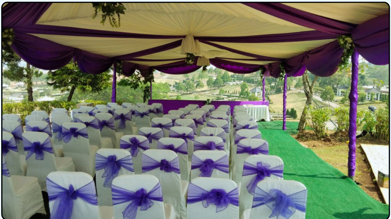
Warna : Biru dan Ungu