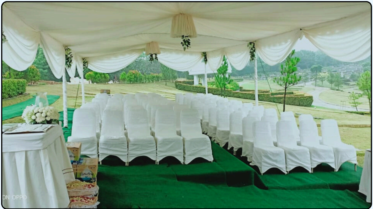
Warna : Putih dan Putih