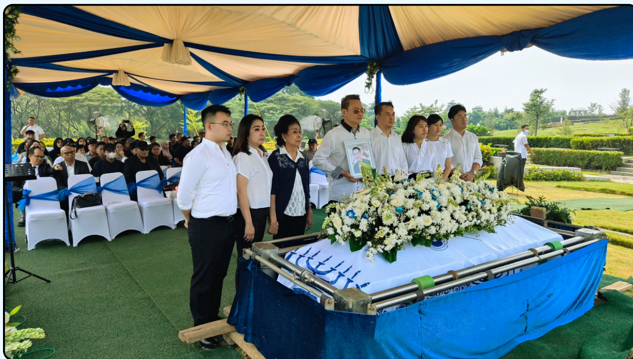
Warna : Biru dan Krem