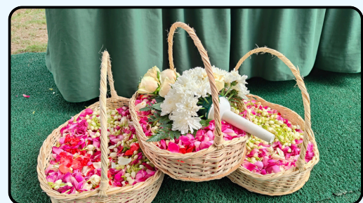
5 keranjang bunga tabur