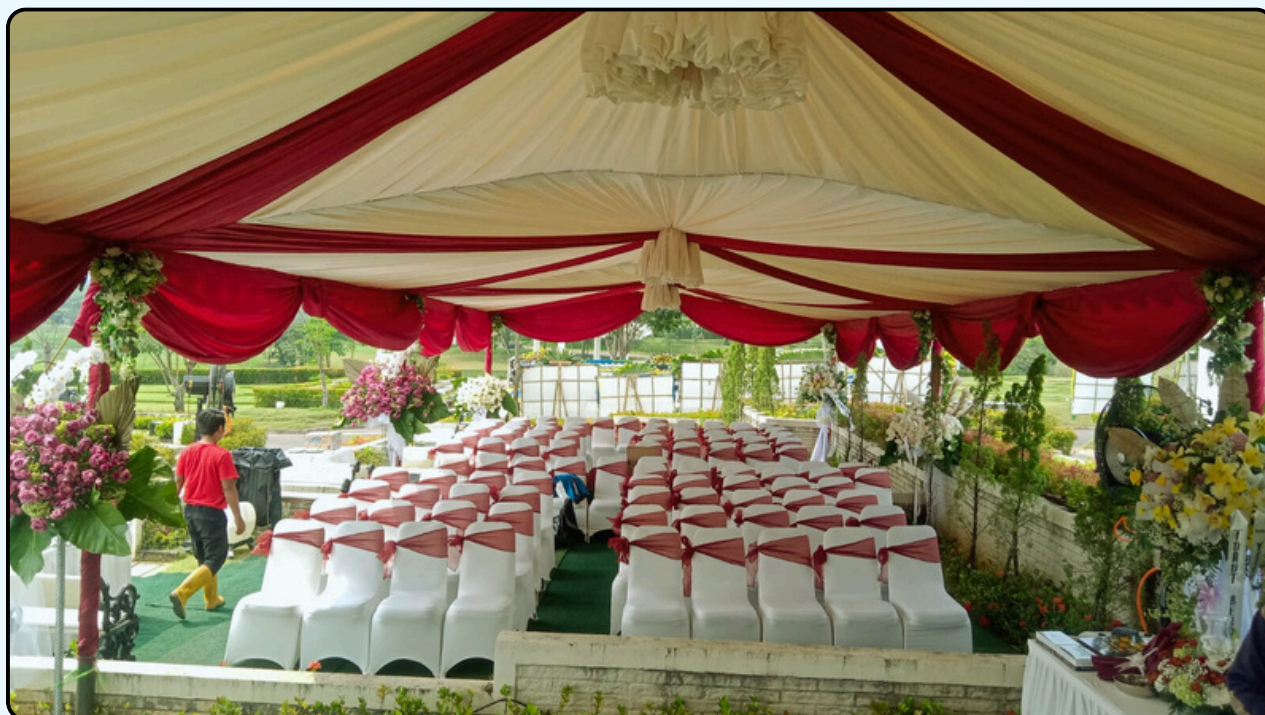
Warna : Maroon dan Krem